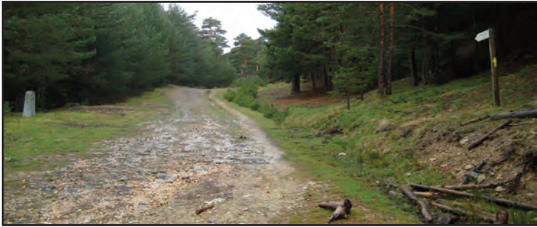
Calzada romana, mojón 595 (a la izquierda).

Los participantes en la etapa corta, aquí tomarán el Camino de los Cospes y después el Camino Schmidt para llegar al Puerto de Navacerrada, donde estará esperando el autobús (1,45-2,00 horas).