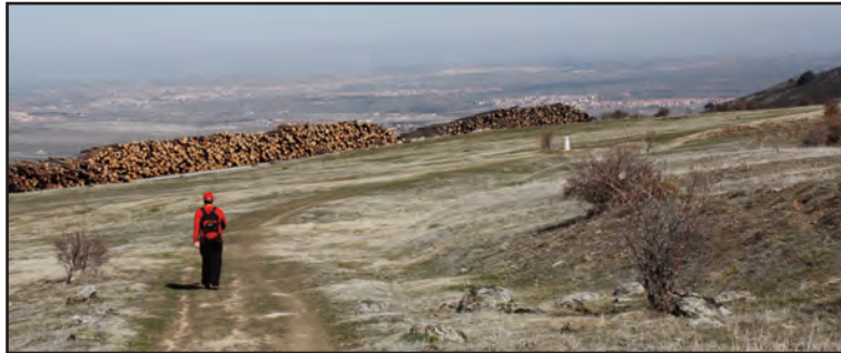
Pradera de la Nava del Rey, mojón 589 (al fondo a la derecha).