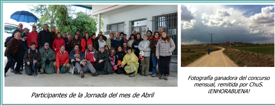
Participantes de la Jornada del mes de Abril